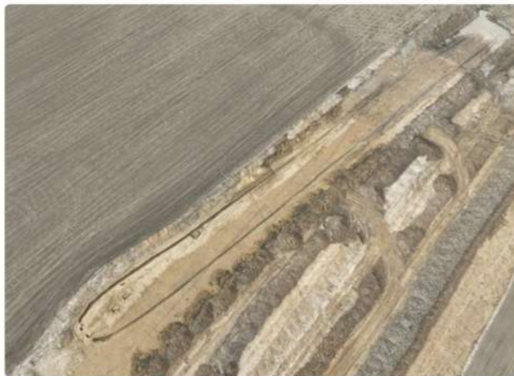
El túmulo prehistórico de 620 pies de largo desenterrado en la República Checa durante las excavaciones a lo largo de la ruta de la autopista D35. Se cree que el monumento funerario data del IV milenio a.C.

Recientemente, arqueólogos de la Universidad de Hradec Králové (UHK) hicieron un descubrimiento revolucionario durante excavaciones a lo largo de una ruta de autopista en la República Checa. El equipo desenterró un enorme monumento prehistórico, un gran túmulo funerario que mide aproximadamente 190 metros de largo y unos 15 metros en su punto más ancho. Este hallazgo significativo arroja luz sobre las prácticas funerarias y las estructuras sociales de las comunidades antiguas en la región.