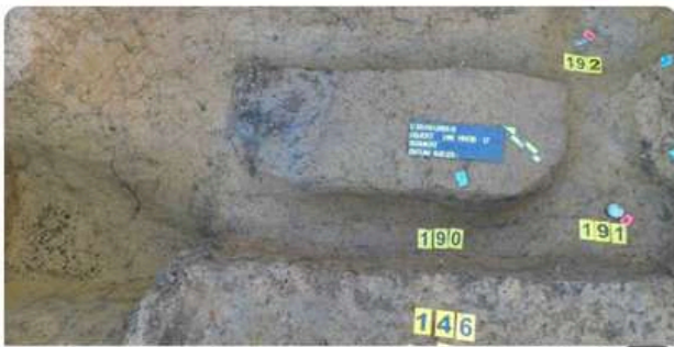
Grave in a mound body.

Además, los sitios arqueológicos a menudo se convierten en importantes destinos culturales y turísticos, contribuyendo a la economía local y fomentando un sentido de orgullo e identidad entre las comunidades. La preservación e interpretación de estos sitios aseguran que el legado de las civilizaciones pasadas continúe inspirando a las generaciones futuras.